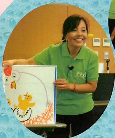
表 現 あ そ び